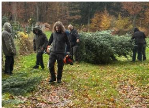
„Unser“ Baum war natürlich erst gaaaanz tief im Wald zu finden.

Und nun freuen wir uns auf den Weihnachtsmarkt in Flomersheim, nun wieder mal mit einem echten Weihnachtsbaum, der hoffentlich das eine oder andere Herz ein wenig höher schlagen lässt.